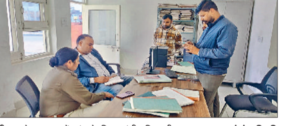
सीवन। वेयरहाउस में जांच के लिए पहुंची पुलिस टीम।

चालक कार को मौके पर ही छोड़ कर फरार हो गया। पुलिस ने मृतक के शव को नरवाना के सरकारी अस्पताल में पोस्टमार्टम के लिए रखवाया है। पुलिस मामले की जांच कर रही है।