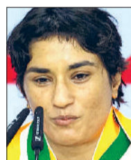
जुलाना विधायक विनेश फोगाट।

जिसके चलते खिलाड़ी सुरक्षित और उचित माहौल नहीं पा रहे हैं। विनेश फोगाट ने बताया कि उन्होंने दो से तीन बार मुख्यमंत्री और खेल मंत्री को लिखित शिकायत भेजकर इस गंभीर समस्या की ओर ध्यान आकर्षित