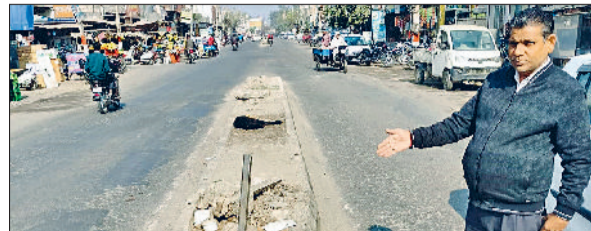
सीवन। सीवन में टूटा हुआ डिवाइडर दिखाता दुकानदार।