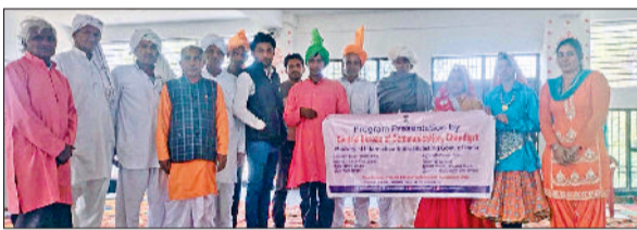
जीद। कलाकारों को सम्मानित करती गांव कंडेला की ग्राम पंचायत।