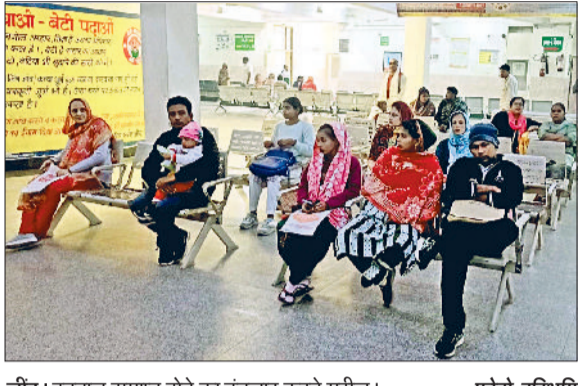
जींद। हड़ताल समाप्त होने का इंतजार करते मरीज।