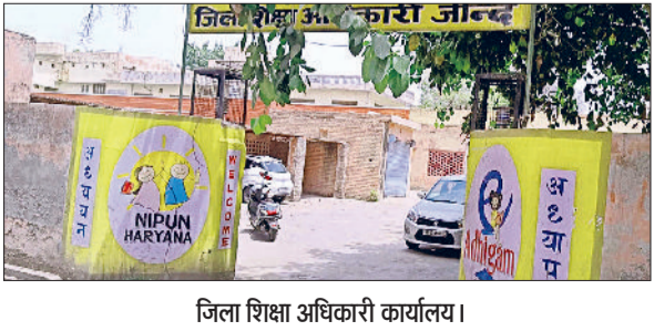
जिला शिक्षा अधिकारी कार्यालय।

राजकीय स्कूलों में पढ़ाने वाले शिक्षकों से अब गैर शैक्षणिक कार्य नहीं किया जाएगा। इसके लिए विद्यालय शिक्षा निदेशालय ने प्रदेश के सभी जिला शिक्षा अधिकारी, जिला मौलिक शिक्षा अधिकारी, जिला परियोजना समन्वयक व खंड शिक्षा अधिकारी के नाम पत्र जारी किया है। अक्सर शिक्षकों को डेप्युटेशन पर कार्यालयों में, बीएलओ व उल्लास परीक्षा में सर्वे सहित अन्य कार्यों पर लगा दिया जाता है। इससे विद्यार्थियों की पढ़ाई प्रभावित होती है। अब 22 दिसंबर से