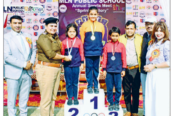
जींद। प्रतियोगिता में विजेता बच्चों को सम्मानित करते हुए।