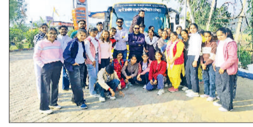
भ्रमण के लिए रवाना होते महर्षि वाल्मीकि संस्कृति विवि के विद्यार्थी।