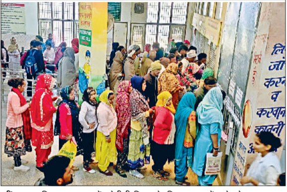
जींद। नागरिक अस्पताल में ओपीडी रिलीफ के लिए लाइन में लगे लोग।

केवल गंभीर मरीजों को ही इमरजेंसी में उपचार मिला और वहां भी मरीजों की भीड़ रही