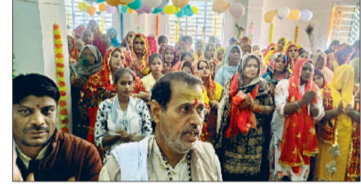
राजौड़। कार्यक्रम में भाग लेते तथा हवन के दौरान यजमान व ब्राह्मण।

कुछ को उपमंडल स्तर पर निरंतर गैर शैक्षणिक कार्यों में लगाया गया है। इस बारे में सभी को जगता होना चाहिए कि यह शिक्षा के अधिकार अधिनियम 2009 के प्रावधानों का स्पष्ट उल्लंघन है। आर्टीई एक्ट की धारा 27 के अनुसार विद्यालयों के अध्यापकों को किसी भी प्रकार का गैर शैक्षणिक कार्य नहीं सौंपा जा सकता है, सिवाय उन कार्यों के जिन्हें अधिनियम में विशेष रूप से छूट प्रदान की गई है।